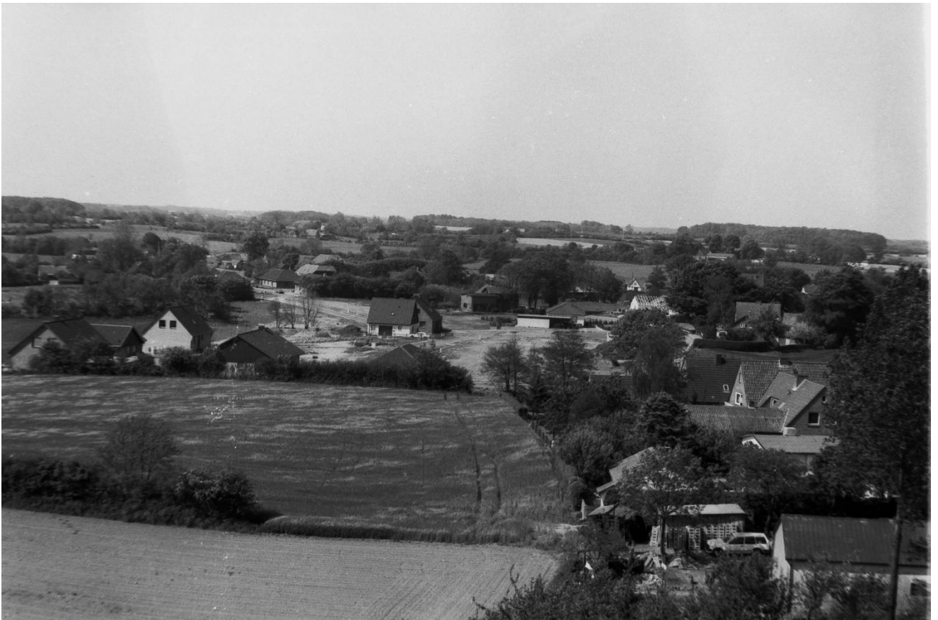
Nach Süd West: Das Baugebiet Quellenthal mit den ersten Häusern