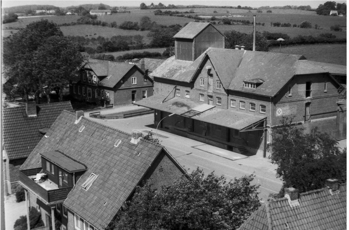
Nach Nord West: Die ehemalige Bank, die „Kasse“ und Marxsen