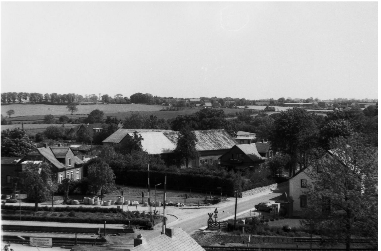
Nach Norden, links Lunkheit, rechts das ehemalige Bahnhofhotel, in der Mitte Petersen. Ganz hinten die Allee nach Mohrkirchen, die ehemalige Grundschule und die Halle Brix